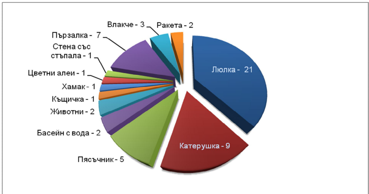
Фигура 3: 45 деца от Хасково са посочили любимите си „неща“ на детската площадка. Някои деца са дали повече от един отговор. Цифрите сочат колко деца са посочили определено "нещо."

Допълнителна задача, осъществена по време на изследването, беше да събере данни за предпочитаните елементи на детските площадки. Целта на тази част на експеримента беше да помогне на децата да вземат решения за своята детска площадка в случай, че не могат да имат всичко, което желаят – например, ако инвеститорът разполага с ограничен бюджет. Ето динамиката на детските предпочитания в Хасково: