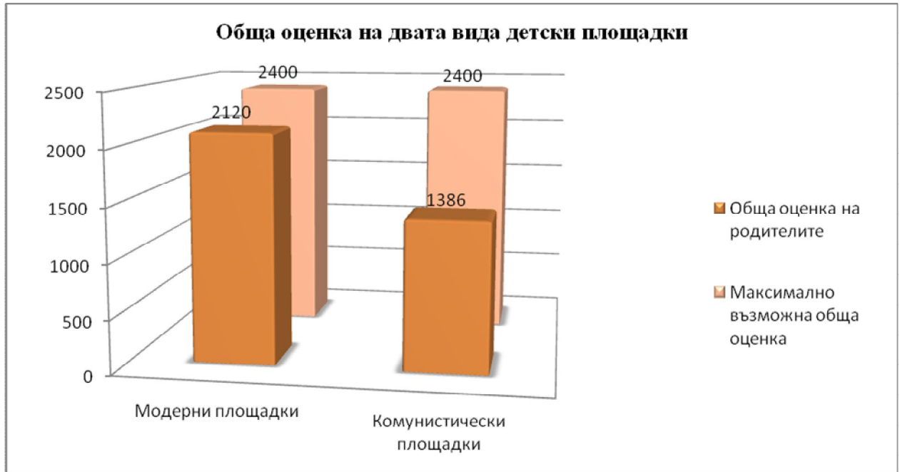
Фигура 2: Обща оценка на двата вида детски площадки, според перспективата на родителите (максимален възможен резултат – 2400 точки)

Допълнителна задача, осъществена по време на изследването, беше да събере данни за предпочитаните елементи на детските площадки. Целта на тази част на експеримента беше да помогне на децата да вземат решения за своята детска площадка в случай, че не могат да имат всичко, което желаят – например, ако инвеститорът разполага с ограничен бюджет. Ето динамиката на детските предпочитания в Хасково: