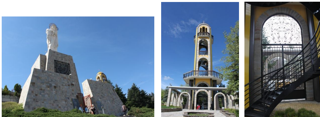
Монументът на Богородица с камбанарията на Ямача – изглед и детайл от интериорна камбанарията.

Доминантната хоризонталната тектониката на камбанарията и фасадното третитиране чрез дребните по мащаб декоративни елементи от ковано желязо, са в контраст със стилистиката и мащаба на бетоновата статуя и минималистичното излъчване на нейния постамент. Скулптурата, характерна много повече за католицизма като изобразителен код на Богородица, контрастира с православния замисъл и доминира над иконостаса на преустройения параклис.