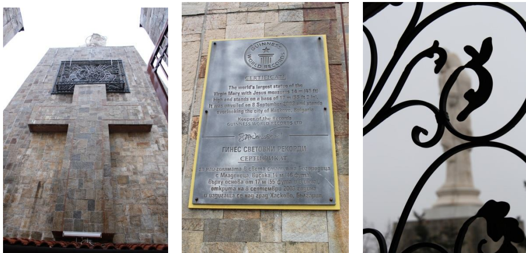
Напластяване на християнска символика върху социалистическия монумент (заедно с витража) – вляво; сертификатът на монумента от Гинес - в средата; детайл от парапета на камбанарията- в дясно; (снимки - автора).

Запазването на оригиналните и несъмнено ценни витражи на социалистическия паметник и след преустройството му, маркира интересна симбиоза между новия символ на града и бившата вече соц-идеология 12 - по своеобразен начин тя остава вплетена в основите на християн-европейски ценности на естетическо ниво, но също и на