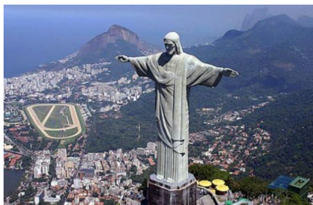
Монументите на Богородица в Хасково и Исус в Рио де Жанейро.