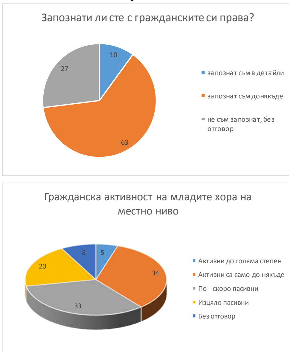
Таблица 3 и Таблица 4 Информация за познаване на гражданските права и гражданската активност на младите хора 3

Интересно е разбирането на запитаните млади по отношение на понятието „гражданската активност“, като 90,5 % посочват гласуване на избори , 81,1 % – доброволческа дейност , 76,2 % - участие в протести , 75 % - участие в обществено обсъждане , участие в подписки и петиции , на последни места поставят членство в младежки организации и политически партии . Въпросът дава възможност за повече от един отговор, като младежите приоритизират.