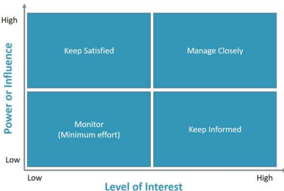
Фигура 1. Power-influence-interest grid (Eden and Ackerman, 1998, 349)

Възприятието за работата със заинтересованите страни се фокусира почти изцяло върху въпроса как да бъде повлияно, а не върху кого да бъде повлияно . Съществуват частично релевантни за предмета на тази статия методи за анализ на заинтересованите страни в академичната литература: Решетка власт-влияние-интерес 8 (Фиг.1), Куб на заинтересованите страни 9 (Фиг. 2), Модел на изпъкналост 10 (Фиг. 3). Нито един от тях обаче не предоставя метод за ранно определяне на заинтересованите страни за проекти за икономическо развитие, а се концентрират основно върху насоки за стратегическата работа с тях. И трите най-разпространени модела, споменати по-горе, се фокусират върху характеризирането на стейкхолдърите, нивото на тяхното влияние, релевантност за дадения проект или компания. Така например прилагането на метода Куб на заинтересованите страни стартира със съставяне на списък със стейкхолдъри, следвано от определяне на нивото на заинтересованост. Липсва обаче дефиниция на факторите, влияещи върху съставянето на входящите данни, тоест върху определянето на заинтересованите страни. Съставянето на списък със стейкхолдъри бива възложено на комуникационните специалисти и разчита изцяло на тяхната лична оценка, което превръща автоматично входящите данни в субективни.