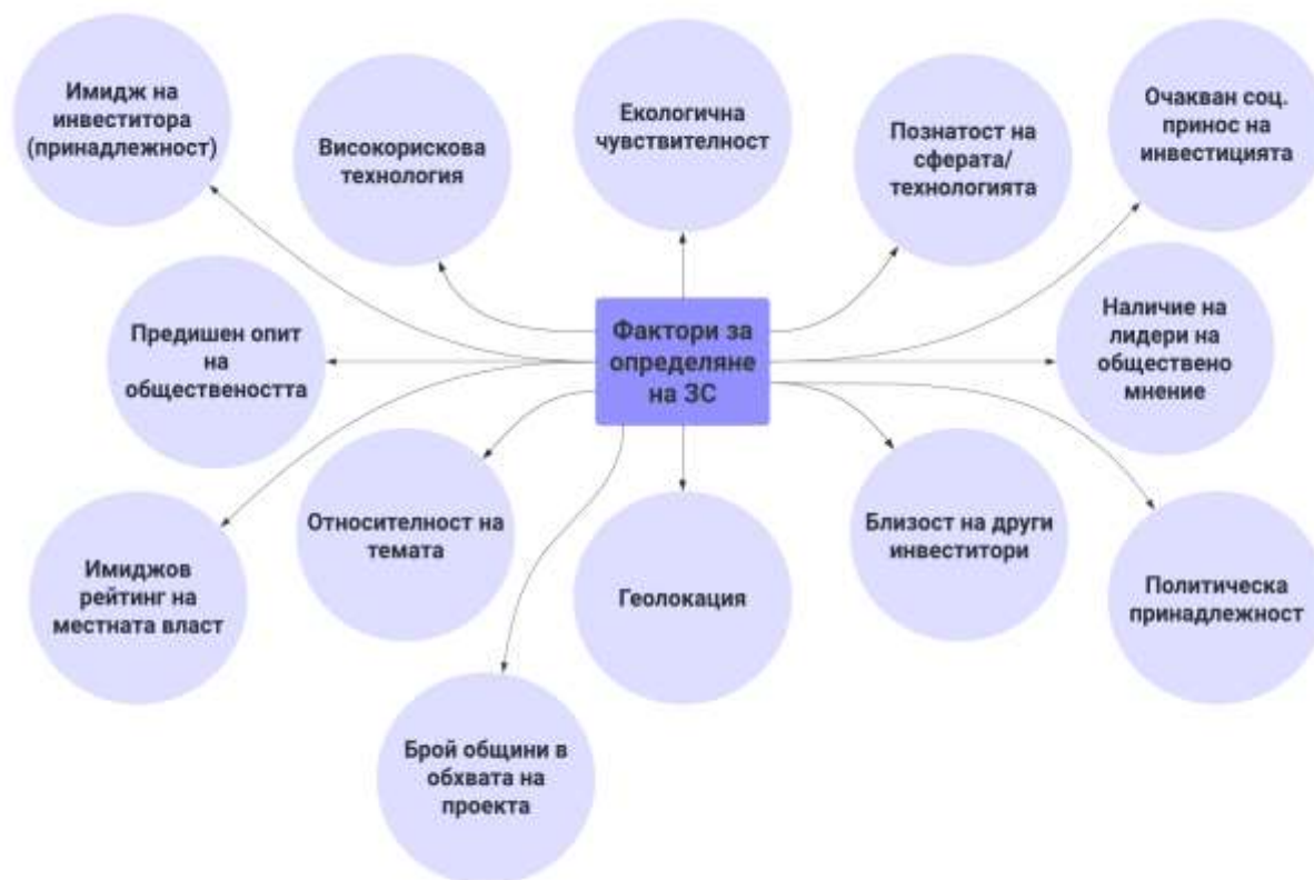
Изображение 1: Мисловна карта на факторите, влияещи при идентифициране на заинтересованите страни при проекти за икономическо развитие в резултат от проведени дълбочинни интервюта за целите на настоящата статия.

Изведените фактори са както следва без целенасочена подредба: