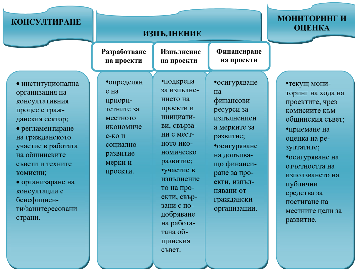
Фиг. №1 Ролята на общинския съвет във взаимодействието с гражданските структури