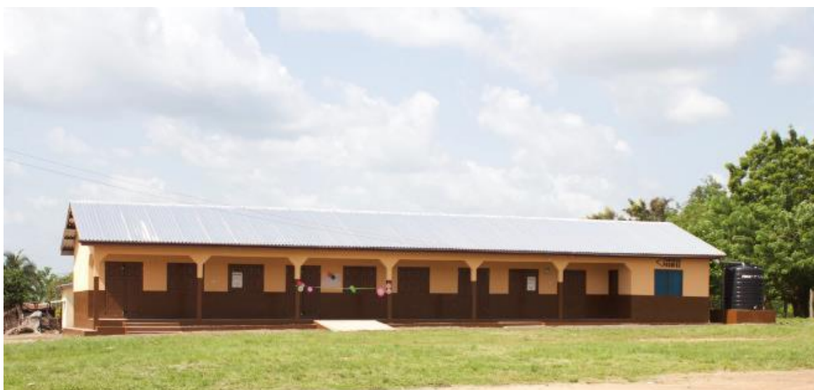
Сградата на построеното чрез краудфъндинг кампания Adaklu Torda Pre-School and Primary School.

Външни измерения: в crowdfunding кампанията се включват над 300 души от различни държави, които даряват 28 780 долара, а самите ученици доброволстват в дейностите на кампанията. В резултат е построена нова училищна сграда за 78 деца и 10 учители в района Волта в република Гана. Местната общност в Адаклу Торда се развива, като се организира и участва с безвъзмезден труд в строежа. Училището е открито на 11 ноември 2015г. На сградата е поставена възпоменателна плоча с надпис на английски език: “Dedicated to ordinary people who can make an extraordinary difference. - 10A Class, Silistra, Bulgaria” 12 (Pelehach, 2015c).