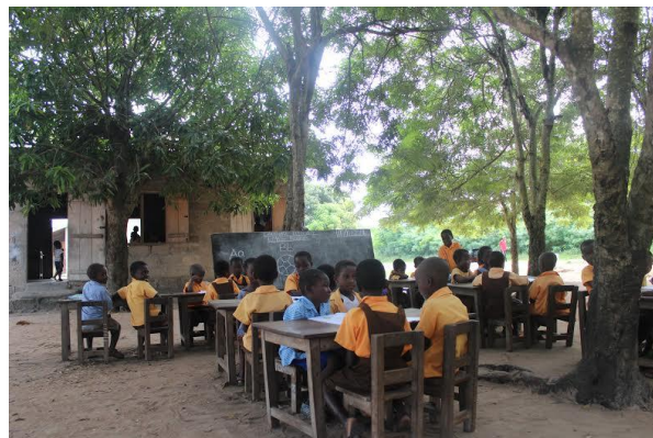
Учебни занятия в Адаклу Торда преди построяването на ново училище.